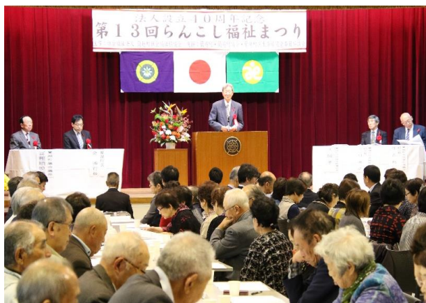
社会福祉法人 蘭越町社会福祉協議会