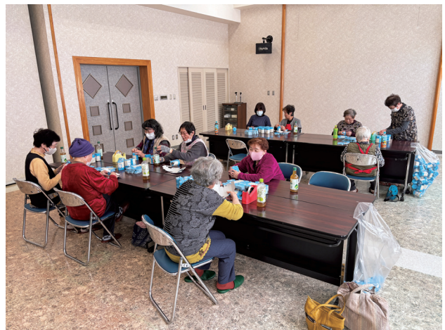
母子寡婦会紙製募金箱作成 (3月13日/ふれあいプラザ21)