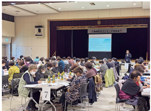
ボランティア交流会 (3月24日/山村開発センター)

社会福祉法人 蘭越町社会福祉協議会 〒048-1301 北海道磯谷郡蘭越町蘭越町 8 番地 2 (ふれあいプラザ 21 内) TEL : 0136-57-5203 FAX : 0136-57-5993