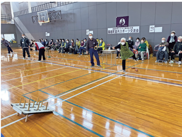
室内スポーツ交流会 (3月18日/総合体育館)