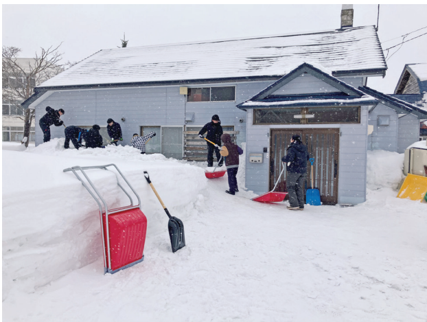
蘭越高校生除雪ボランティア活動 (2月13日/蘭越町内)