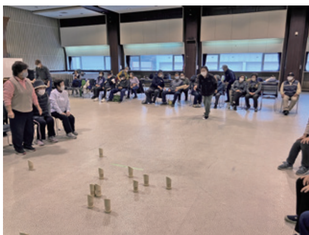
老人クラブ連合会モルック体験講習会