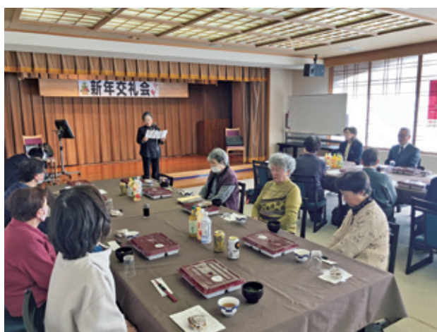
母子寡婦会・身体障害者福祉協会新年会