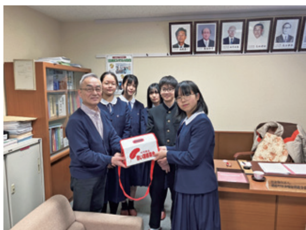
蘭越中学校歳末たすけあい募金 (街頭及び校内募金)