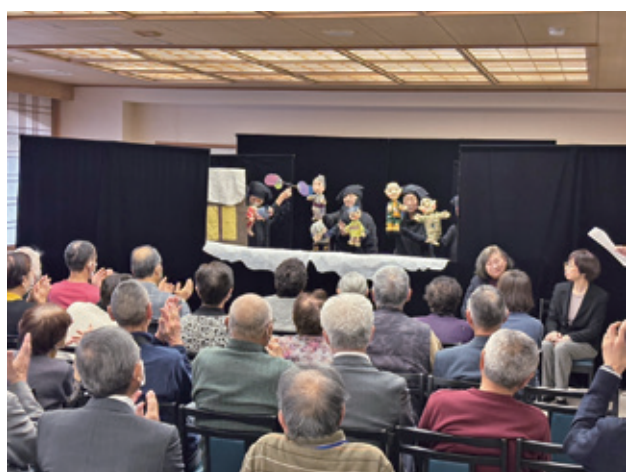
身体障害者南後志ブロック研修会